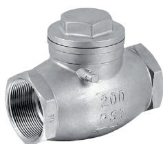
355K Zawór zwrotny kłapowy gw/gw