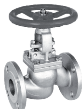
383F Zawór grzybkowy kołnierzyowy PN16