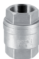
360 Zawór zwrotny sprężynowy dwuczęściowy gw/gw