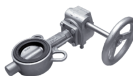
400 Przepustnica międzykołnierzowa PN10