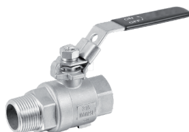
351A Zawór kulowy, dwuczęściowy gw/gz