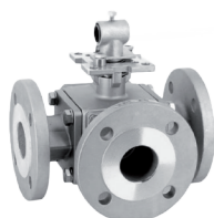
354TF/354LF Zawór trójdrożny kołnierzyowy kula T lub L PN16