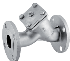
356F Filtr (osadnik) kątowy kołnierzyowy PN16