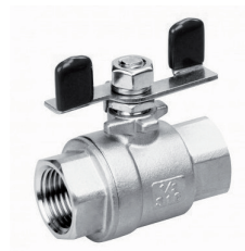
351M Zawór kulowy, rączka-motylek, dwuczęściowy gw/gw