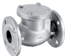
355F Zawór zwrotny kłapowy kołnierzyowy