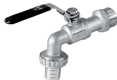
350C Zawór czerpialny (kurek spustowy), jednoczęściowy gw/wąż